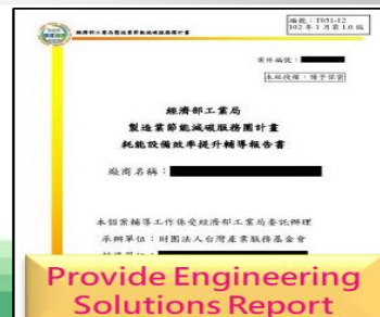
Provide Engineering Solutions Report