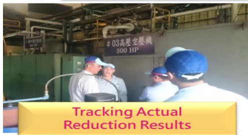
Tracking Actual Reduction Results