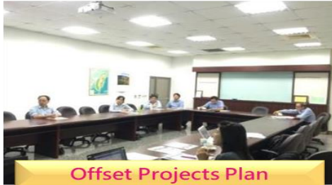
Offset Projects Plan